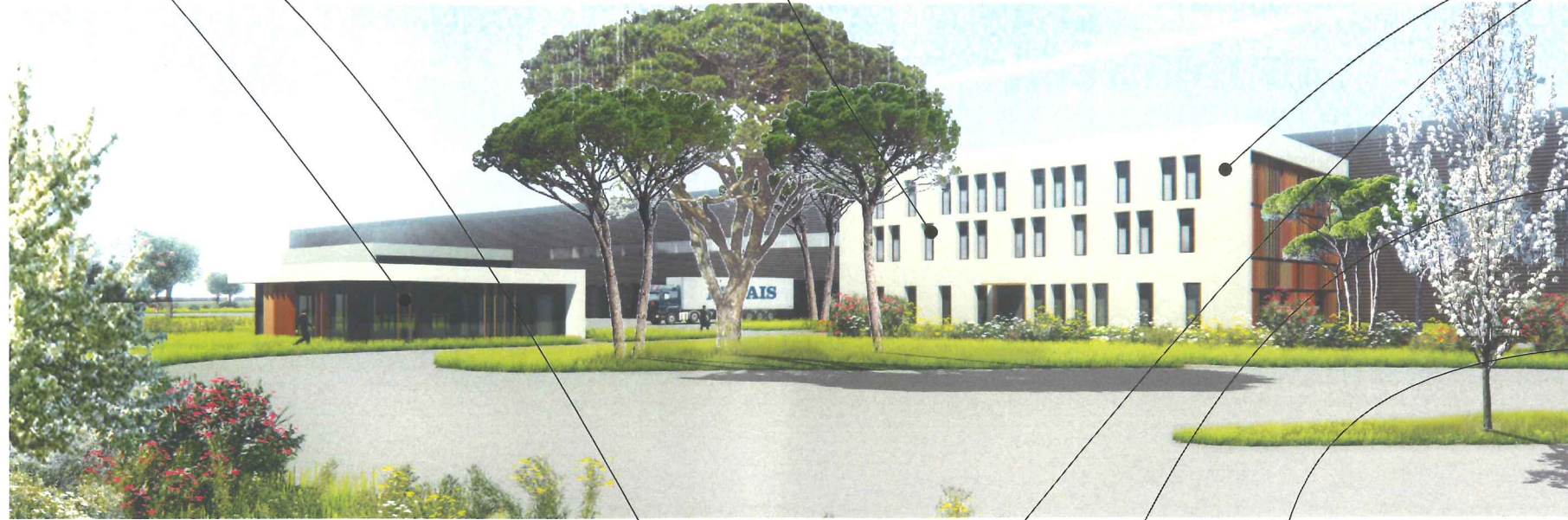
Menuiseries teinte noir foncé RAL 9005