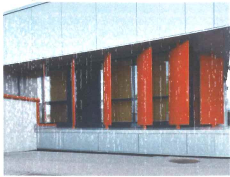
Ailettes métal thermolaqué