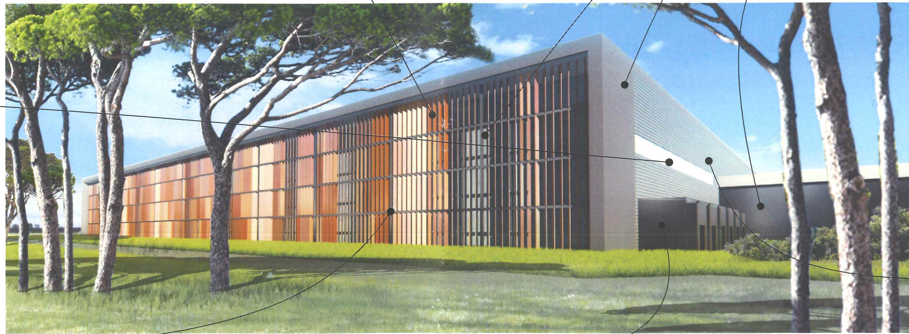
Bardage métallique type OCEANE Teinte gris beige RAL 7006