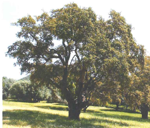
Chêne liège Quercus suber