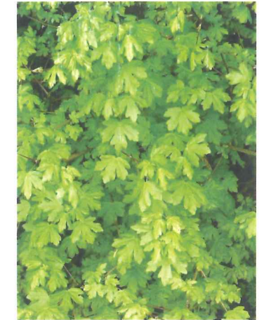
Erable champêtre Acer campestre