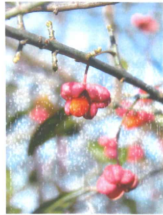
Fusain d'Europe Evonymus europaeus