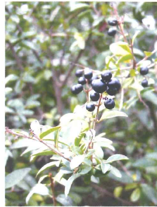
Troène comun Ligustrum vulgare