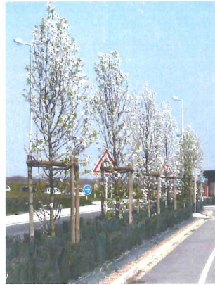
Poirier à fleurs Chanticleer Pyrus calleryana 'Chanticleer'