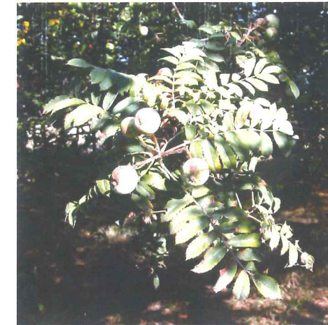
Cormier Sorbus domestica