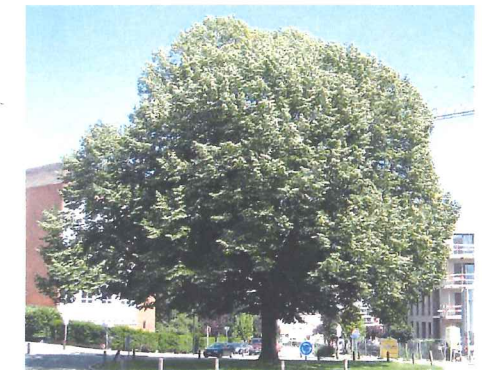
Tilleul argenté (sujet exceptionnel) Tilia tomentosa