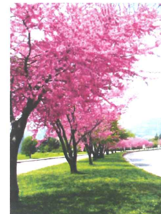
Arbre de Judée Cercis siliquastrum