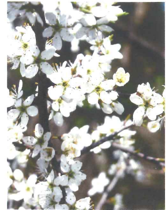
Prunellier Prunus spinosa