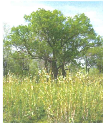
Frêne à feuilles étroites Fraxinus angustifolia