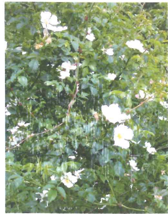
Eglantier Rosa canina