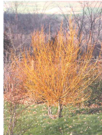
Saule à osier Salix viminalis