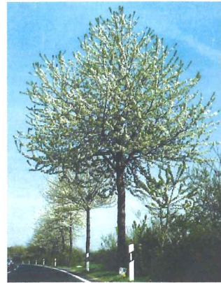
Merisier Prunus avium