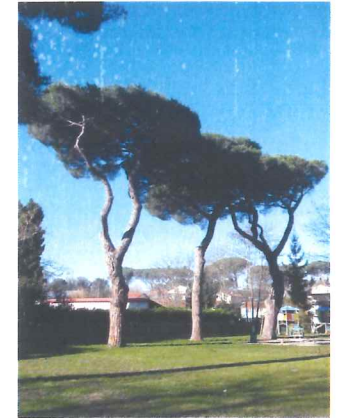
Pin parasol Pinus pinea

Les accotements du bâtiment seront plantés de pins parasols destinés à attirer l'attention depuis les voies périphériques et à l'intérieur du site.