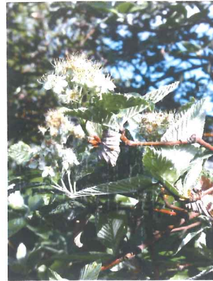
Alisier blanc Sorbus aria

Trois espèces d'arbres ont été retenues en plus de l'alisier torminal déjà cité ci-dessus : l'alisier blanc, l'aubépine de Carrière à la floraison généreuse, le merisier présent dans les bois, le poirier à fleurs de la variété Chanticleer également très florifère.