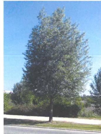
Saule blanc Salix alba