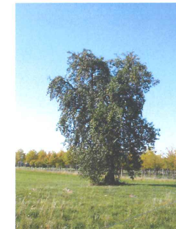
Poirier sauvage Pyrus pyraeaster