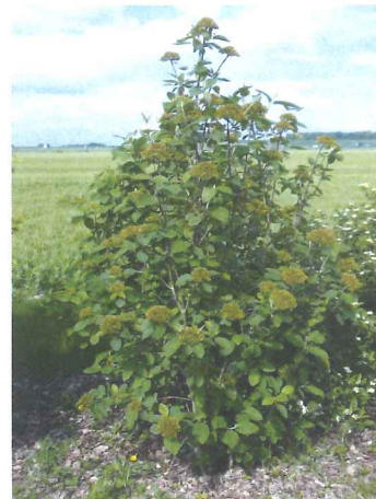
Viorne lantane Viburnum lantana