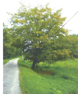
Charme commun Carpinus betulus