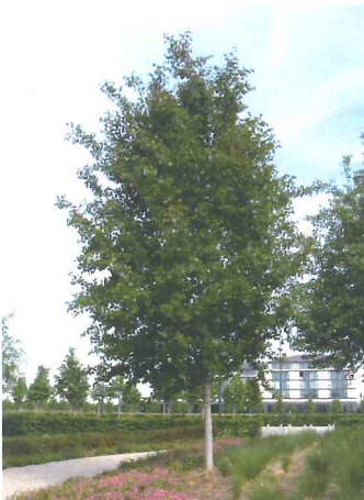
Peuplier tremble Populus tremula