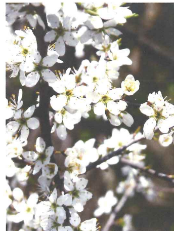
Prunellier Prunus spinosa