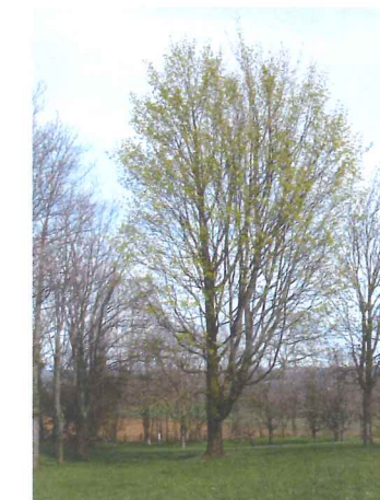
Erable plane Acer platanoides