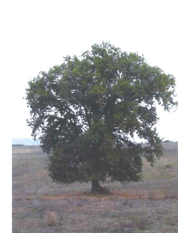
Chêne pubescent Quercus pubescens