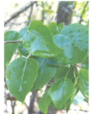
Poirier sauvage Pyrus pyraeaster