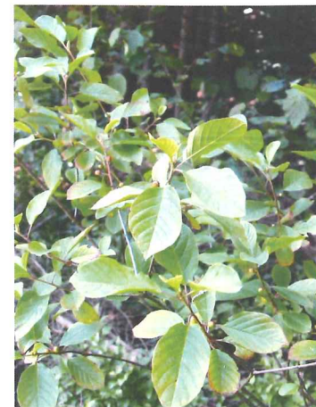
Bourdaine Rhamnus frangula