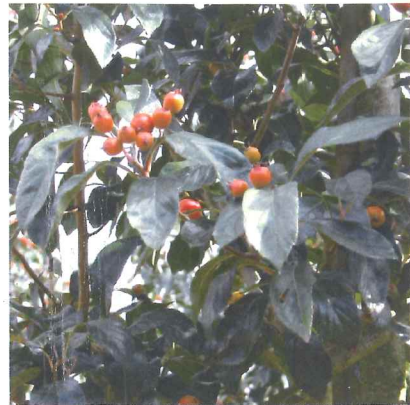
Aubépine de Carrière Crataegus lavalleyi 'Carrieri'