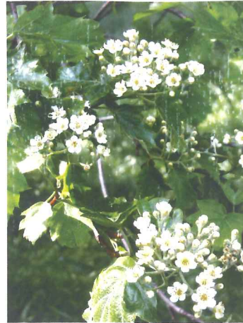
Alisier torminal Sorbus torminalis