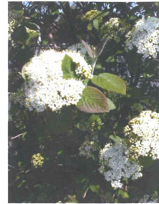
Viorne lantane Viburnum lantana