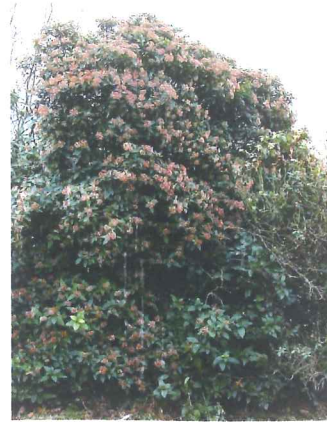
Laurier tin Viburnum tinus