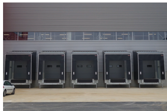
Teinte noir foncé RAL 9005