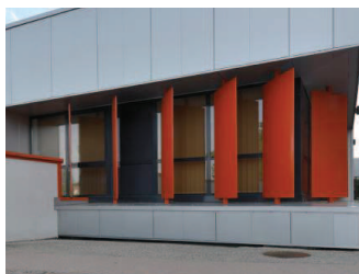
Ailettes métal thermolaqué