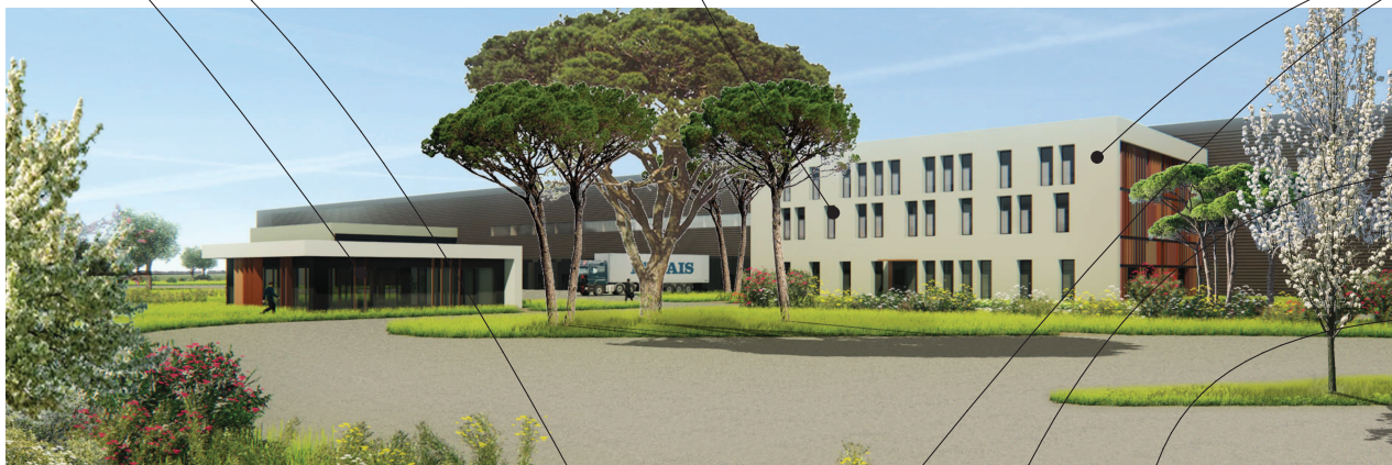
Menuiseries teinte noir foncé RAL 9005